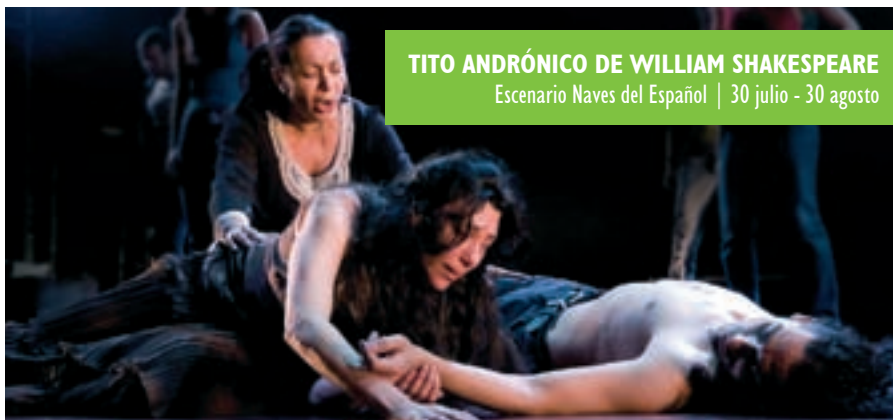
TITO ANDRÓNICO DE WILLIAM SHAKESPEARE Escenario Naves del Español | 30 julio - 30 agosto

suma esfuerzos y propuestas con la participación del Teatro Español, el Fernán Gómez, el Teatro Circo Price y las Naves del Español, en Matadero Madrid.