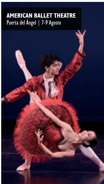
AMERICAN BALLET THEATRE Puerta del Ángel | 7-9 Agosto

Del mismo modo, son ya imprescindibles citas como Titirilandia, para los más pequeños, o el sinfín de películas que nos propone el Festival de Cine de la Bombilla; al igual que la colaboración con la Asociación de Salas de Música en Directo, por segundo año consecutivo, y, cómo no, las programaciones del Teatro Pradillo y de la Cuarta Pared, con las que se ha consolidado una relación estable para estas noches estivales. ■