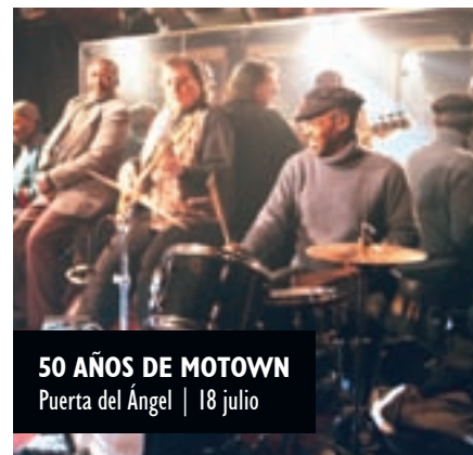
50 AÑOS DE MOTOWN Puerta del Ángel | 18 julio

“Citas como Titirilandia, para los más pequeños, el Festival de Cine de la Bombilla o el Teatro de Pradillo abarcan todos los gustos.”